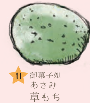
11 御菓子処 あさみ 草もち

氣比神宮の門前町である神楽商店街には昔ながらの伝統を受け継ぐ和菓子店が数多く残っています。名産品の昆布を練り込んだ求肥昆布や夏のお菓子水仙まんじゅうなど敦賀ならではの味が楽しめます。