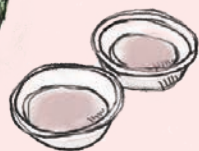
10 御菓子司 浅海分店 水仙まんじゅう