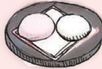
8 天清酒万寿店 酒まんじゅう