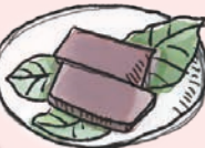
7 御菓子司 森本 水ようかん