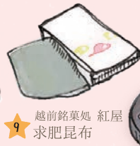
9 越前銘菓処 紅屋 求肥昆布